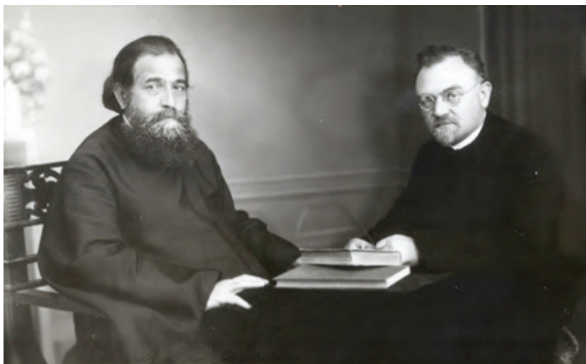
Biskup Gorazd (vpravo) s biskupem Srbské pravoslavné církve Serafimetem (Jovanović) Епископ Горазд (десно) са епископом Српске православне цркве Серафимом (Јовановићем)