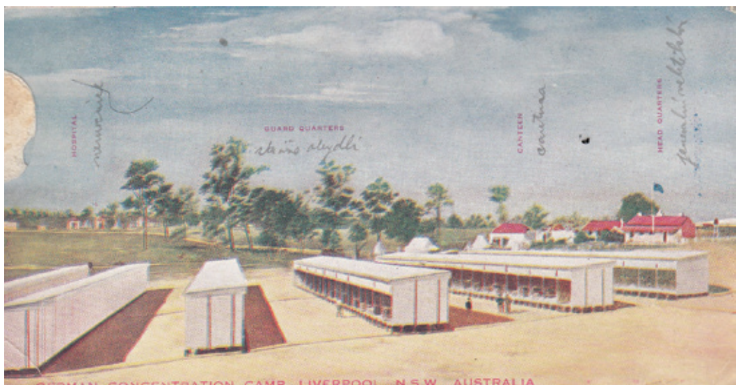
Internční tábor v Liverpoolu. V rámci tábora bylo i divadlo nebo venkovní tělocvična. Dobová pohlednice z roku 1916.

Интернаційски лагерь у Ливерпулу. У лагерьу је било позориште и уроствор за вежбање на отвореном. Разгледница из 1916. године.