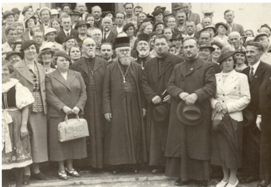
Biskup Gorazd uprostřed věřících na pouti v Jugoslávii v r. 1937

čemž ve druhém případě kongruální příspěvek, vyplácený v odstupňované míře podle dosaženého vzdělání kněží, 67 mohl být zakomponován do položky dotace pro biskupa nebo mimořádných potřeb eparchie. Na druhé straně Gorazdův pokus, připravený ve spolupráci se srbským biskupem, prosadit rovněž nárok na odškodnění církve za újmu, kterou utrpěla díky chybám státní administrativy v důsledku ignorace právní kontinuity mezi organizacemi pravoslavných v Československu a na území habsburské monarchie v letech před Velkou válkou, pohybující se ve výši 10–14 mil. Kč, neuspěl. V každém případě je však Gorazdův podíl na tzv. Damaskinově memorandu z roku 1932 jeho posledním významným zásahem do dějin mukačevsko-prešovské eparchie.