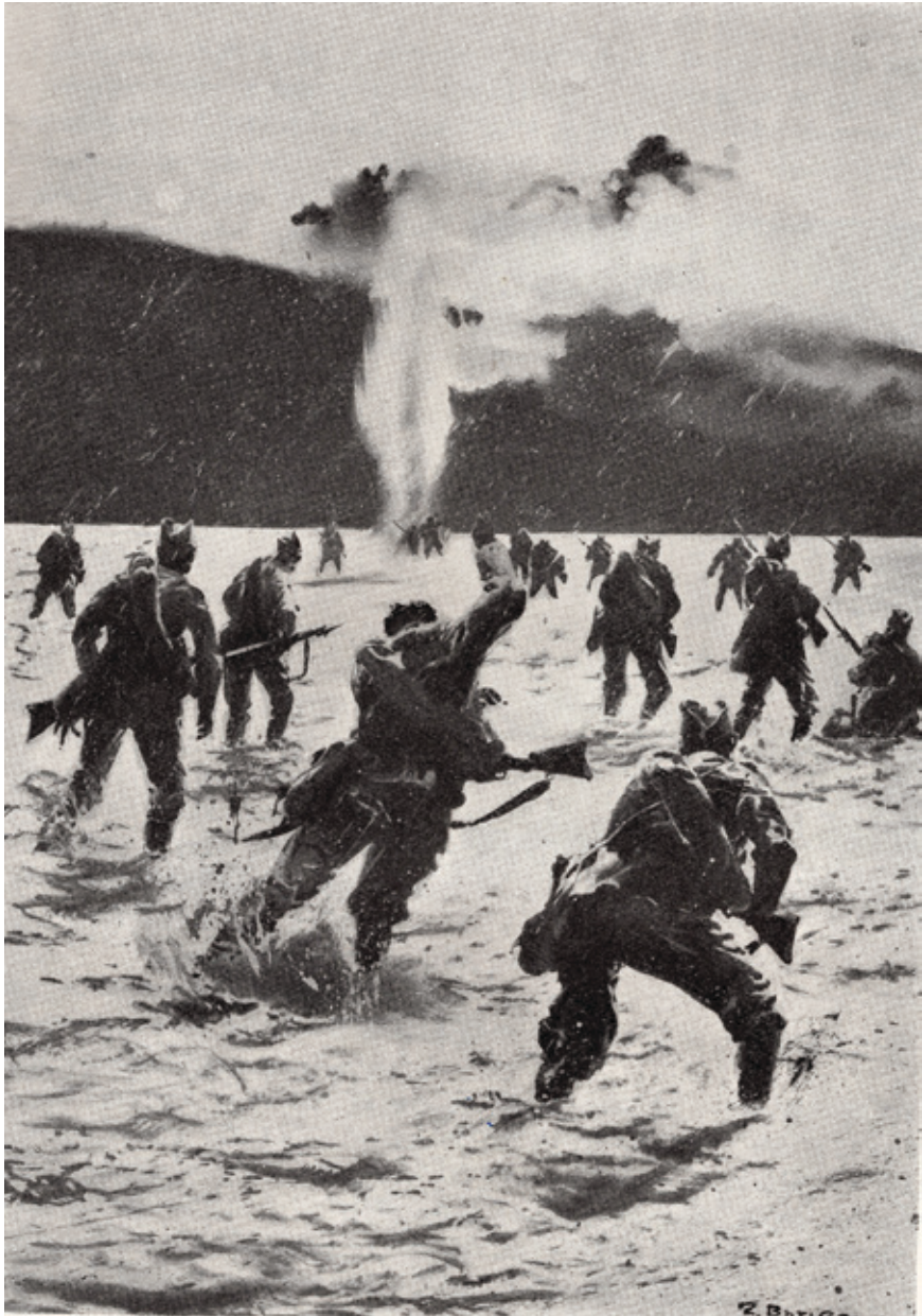
Вой в Добруджі на ілюстрації зна́того чеського в́йтоварника Зде́йка Буриана Бійка у Добруці на ілюстрації чеської ликовної мейника Зде́йка Буријана