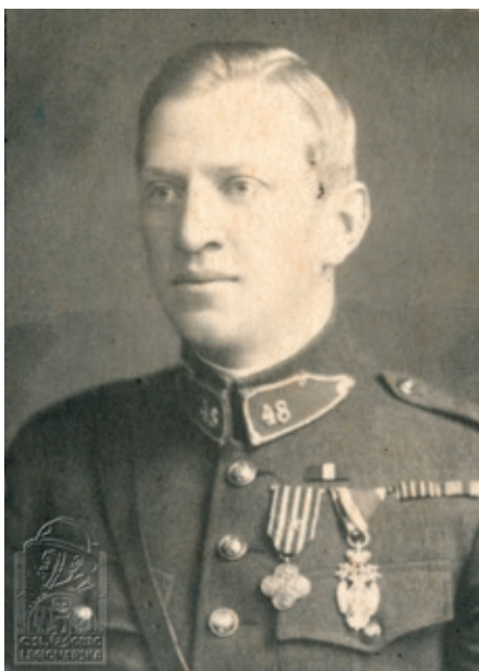
Antonín Pavlík jako velitel 48. pěšího pluku Jugoslavie

V bojích u francouzského Terronu, v nichž se se vyznamenal 21. pluk československé střelecké brigády mezi 21. a 23. říjnem 1918 a poté u Vouziers, kde bojoval zejména 22. pluk brigády, padli mnozí, kteří bez úrazu před tím bojovali na soluňské frontě. Polovina všech padlých důstojníků pocházela ze „srbských“ řad. Mj. také poručík Miloš Wurm, jenž zahynul 24. října 1918 v Chestres u Vouziers při bojích o kótu 153. 195