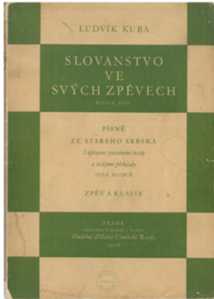
Насловна сйрана збирке њесама из Сйаре Србије Лудвика Кубе из 1928. ѓодине Titulní strana sbírky písní ze Starého Srbska od Ludvíka Kuby z roku 1928

педагогији. У Фрајтовој едукативној едицији она је најбројнија: Гудачка техника ой. 2 (шест свезака), НО 147, Промена позиција ой. 8 , НО 175, Виолинска школа за ђочетнике оп. 6 (седам свезака), НО 182–188 и Предвезбе за двојне трифове ой. 9 , НО 242.