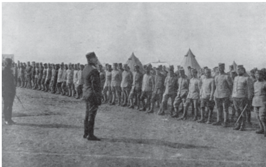
Českoslovenští dobrovolníci nastoupení v táboře u přístavu Mikra u Soluně před odchodem do Francie

Чехословацки добровољци у логору покрај луке Микра код Солуна пре одласка у Француску