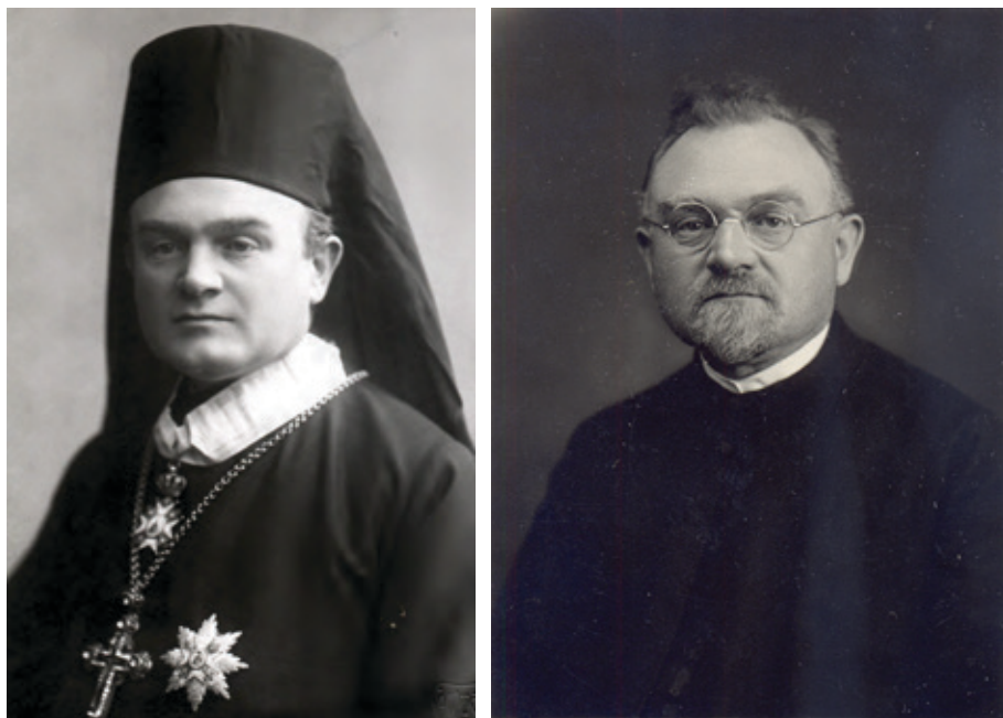
Dvě fotografie prvního českého pravoslavního biskupa Gorazda (Pavlíka) z různých časových období

Две слике првої чешкої православної єпископа Горазда (Павліка) из различных временских периодов