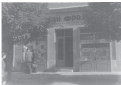
Фрајтџова радња у Ресавској/ Франкојановој улици бр. 5 пре бомбардовања 1944.

Frajtova dílna v Dečanské ulici č. 21, kolem roku 1921