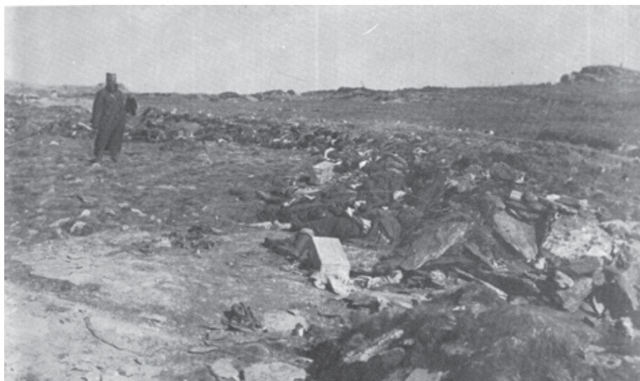
Generál Djurdje Lazić po bitvě na vrcholu Kajmakčalanu obhlíží dobytá bulharská postavení.

Генерал Ђурђе Лазуић после бијвке на врху Кајмакчалан обилази освојене бујарске иоложаје.