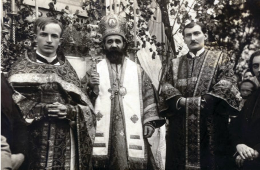
Biskup Dositej (uprostřed) po vysvěcení prvního kněze v Československu Václava Zdražily (vlevo) v roce 1921. Vpravo Dositejův sekretář Ljubislav Niketić

Єпископ Доситєй (у середини) 1921. їодинє їосле рукоїоложења Вацлава Здражилє (лево), їрвої свєшїїєника у Чєхословачкої. Дєсно Доситєйєв сєкрєїар Лїубислав Никєїїїї