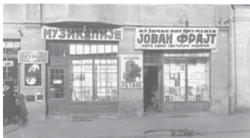
Фрајтџова радња у Дечанској улици бр. 21, око 1921.

Frajtova dílna v Dečanské ulici č. 21, kolem roku 1921