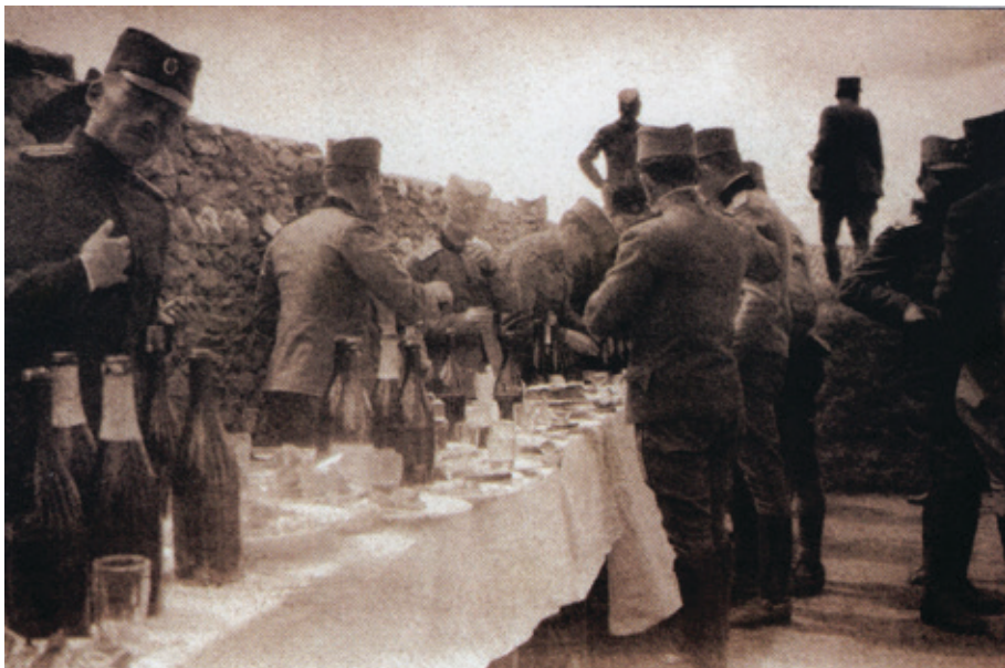
Důstojnický život v zázemí na konci roku 1917... Foto z publikace Ilić, Dragana Lazarević: The Thesaloniki Front see by the Eyes of the Contemporaries-Diary and Photographs of the War Painter Dragoljub Pavlović. Valjevo: National Museum, 1918

Официрски живои у њозадини крајем 1917... Фотографија из њубликације Dragana Lazarević Ilić: The Thessaloniki Front see by the Eyes of the Contemporaries-Diary and Photographs of the War Painter Dragoljub Pavlović. Valjevo: National Museum, 1918