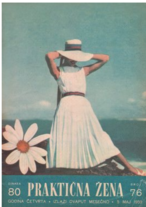
Сл. 6. Практична жена , насловна страна, број 76, мај 1959.