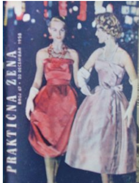
Сл. 4. Практична жена , насловна страна, број 67, децембар 1958.