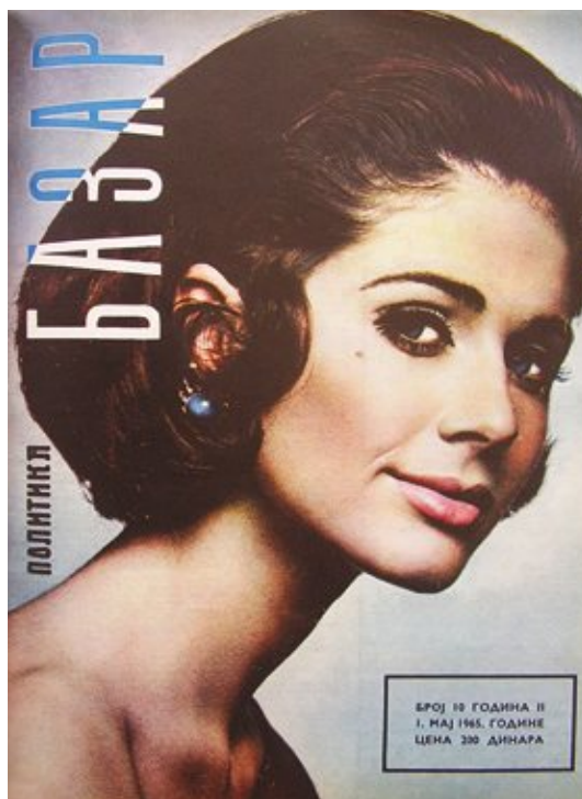
Сл. 7. Базар, насловна страна, број 10, мај 1965.