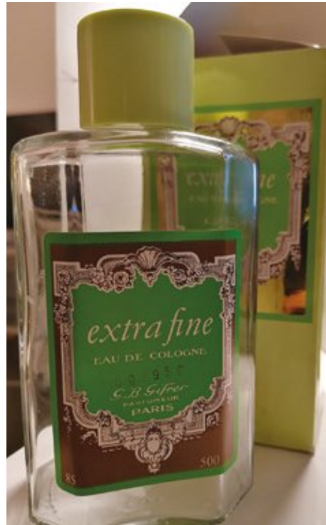
Сл. 1. Парфемска боца, Компанија „Жифре” (приватно власништво)