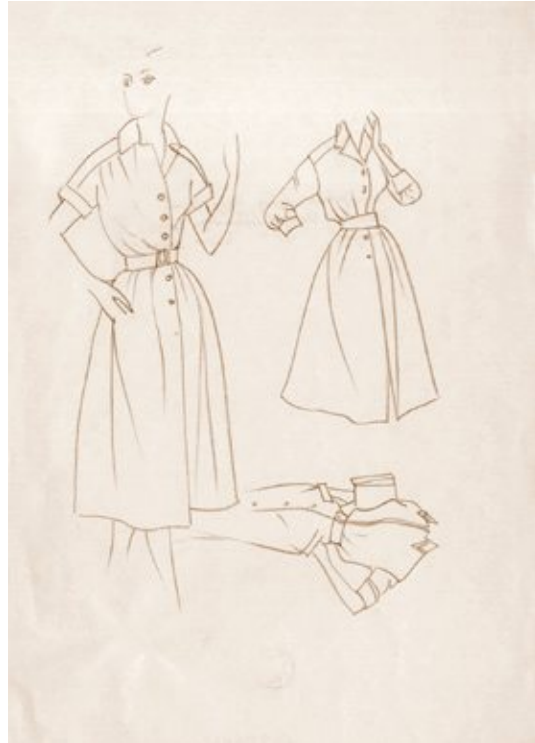
Сл. 8. Љубица Цуца Сокић, Скица женске хаљине, модна илустрација, графитна оловка 30 × 20 цм (Графичка збирка Народне библиотеке Србије, Заоставштина Љубице Цуце Сокић НБС, ЦСГр 5/34)

Но, поетика Цуце Сокић као модне илустраторке није само у складу са француском високом модом већ и њеном рецепцијом и конфигурацијом у Југославији и уже, Београду. У првом реду, блискост илустрација Сокићеве са модним цртежима модне креаторке Анђелке Слијепчевић (1931–2010) која крајем 1950-их борави у Паризу радећи за „Ланвин” (ŽARIĆ 2022), показује на који је начин модни диктат Кристијана Диора, чија модна кућа заједно са „Ланвином” и „Баленсијагом” представља моделе на сајму Мода у свету у Београду 1959. године, локализован у југословенској визуелној култури и култури одевања 1950-их и 1960-их. Заједничка иконографија са визуелним репертоаром насловница домаћих модних часописа такође није случајна. Она одсликава циркулацију западне високе моде и њено прилагођавање домаћим материјалним и естетским условима, нарочито када се узме у обзир да су насловне стране домаћих часописа, чак и када је