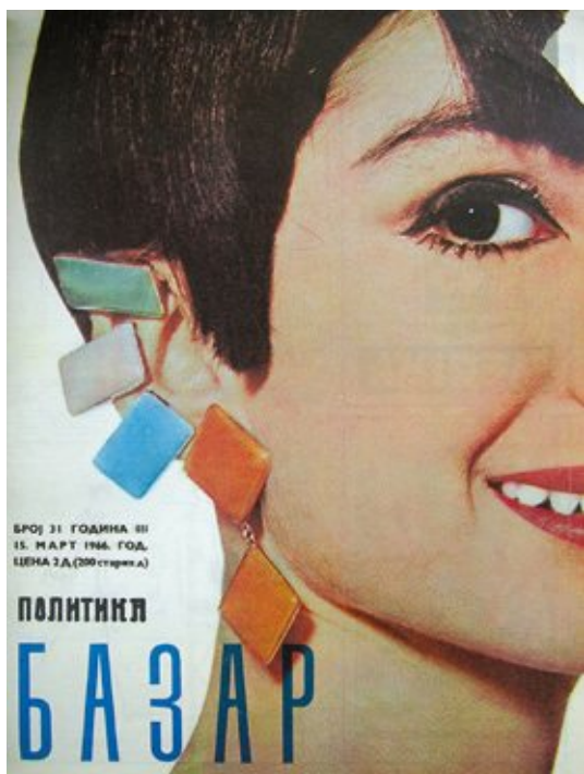
Сл. 2. Базар , насловна страна, број 31, март 1966.

косе различитих форми и дужина, шминке у првом плану, очију уоквирених црном маскарном или ајлајнером, једноставних костима равних линија, с једноредним или дворедним копчањем, могуће је пружити оквирно датовање Цуциних сачуваних илустрација. Чак и летимичним погледом на неколицину насловних страна Базара (издања 1. мај 1965, 1. јун 1965. или 15. март 1966) откривају се извори њене инспирације за фризуре, троугаоне или кружне наушнице јарких боја, па чак и поједине одевне детаље, чиме је отворен пут ка сигурнијем временском позиционирању сликаних предлогака у крај шесте и прву половину седме деценије XX века (сл. 2). Праволинијске, цигарет-хаљине, жакети и блејзери високих крагни с крупним дугмадима, блузе са ве изрезима, саставни су делови визуелних решења, иако је њихова примарна намена козметика, а не мода (МЕТЛИЋ 2020: 198). После Другог светског рата долази до неумитног повезивања индустри-