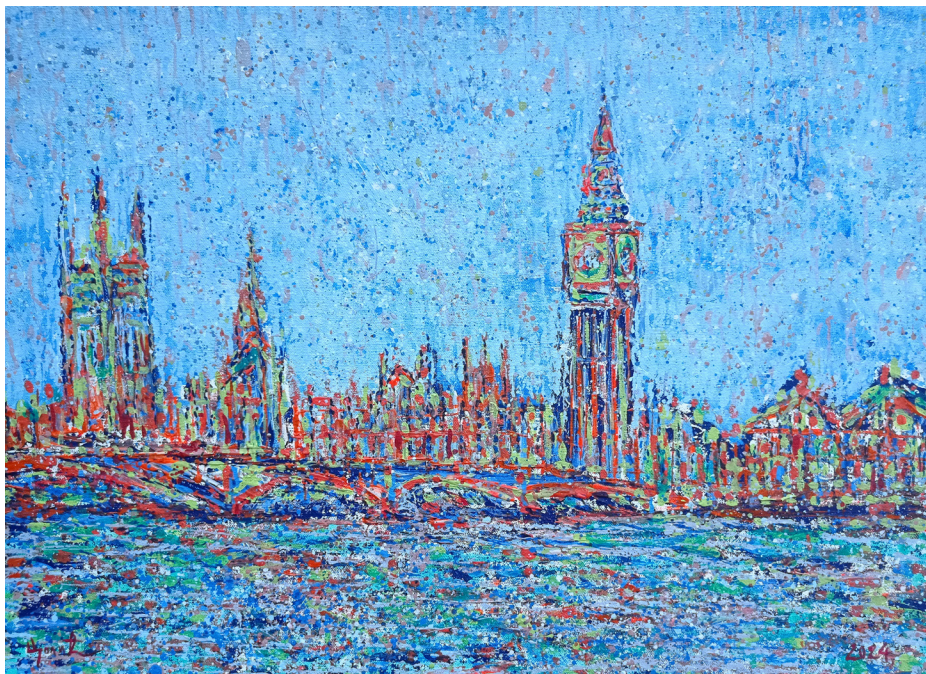
„Лондон”, акрил на платну, 50x70цм, Угљеша Цолић, 2024.